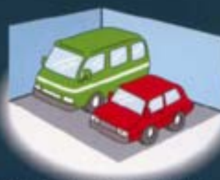
■設計によっては（地下駐車場）として