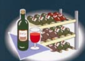
■地下で温度が低いため（ワインセラー）として