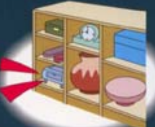
■その他（貯蔵庫）（ホビールーム）として