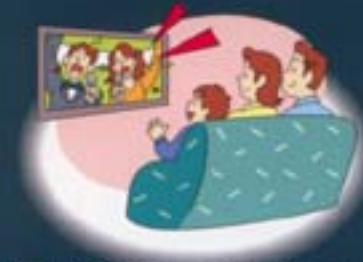
■音が外へ漏れないため（カラオケルーム）（ホームシアター）として

いざというときは防災シェルターとしての機能を発揮しますが、日頃はいろいろな用途にお使いいただけます。外部と遮断した丈夫なアメニティルームを一室つくる、そんな発想でご計画ください。